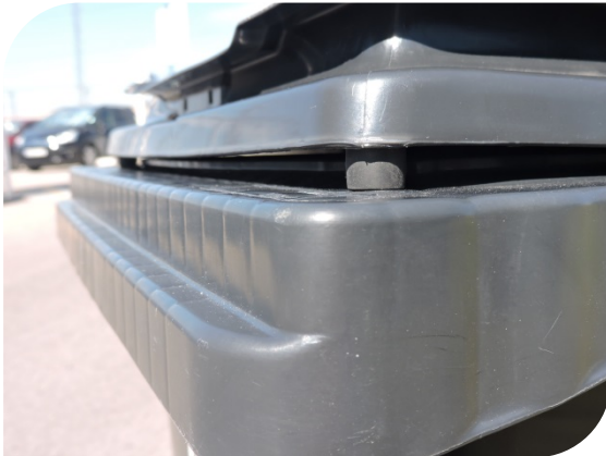
Tope de goma en la tapa