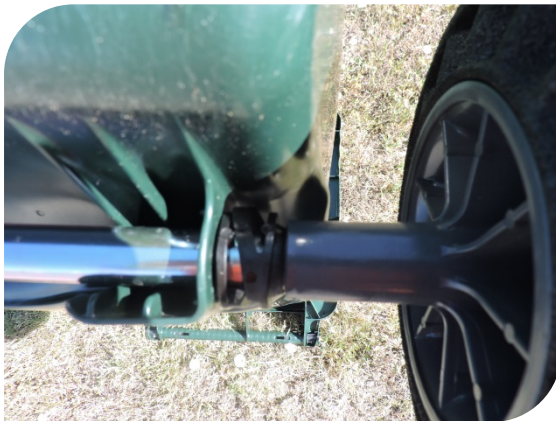
Ruedas insonorizadas mediante compensador