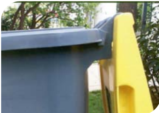
Amortiguación de apertura de la tapa